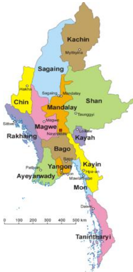
รูปแสดงเขตการปกครองของเมียนมาร์

1.4 สมาชิกองค์การระหว่างประเทศ : เข้าร่วมเป็นสมาชิก GMS เมื่อปี 2535 / สมาชิกอาเซียน เมื่อวันที่ 23 กรกฎาคม 2540 / สมาชิก BIMSTEC เมื่อวันที่ 22 ธันวาคม 2540 / สมาชิก WTO เดือนมกราคม 2538